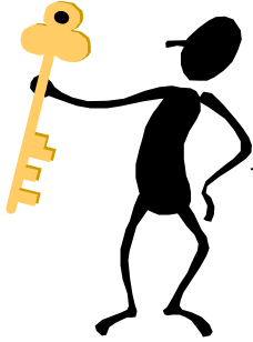
Schéma descriptif remise d'un véhicule hors d'usage