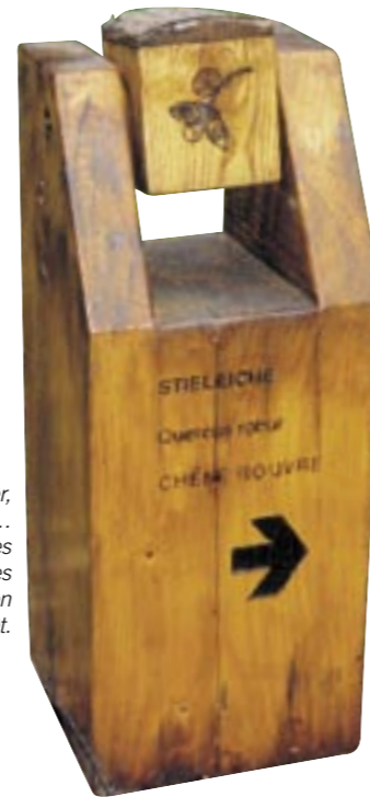
Observer, toucher, découvrir en jouant... Testez vos connaissances sur les stations didactiques du Sentier d'Exploration de la Forêt.