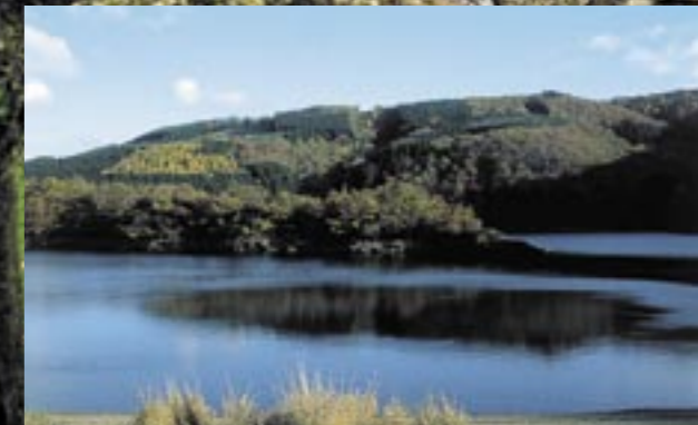
Remarquablement idyllique – un lac créé par l'homme pour la production d'eau potable.