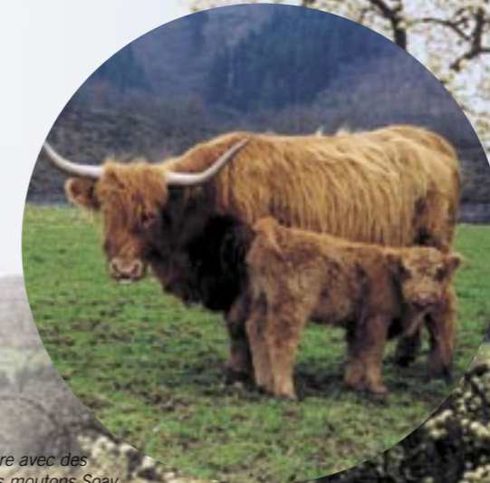
Rencontre spectaculaire avec des bovins Highland et des moutons Soay.