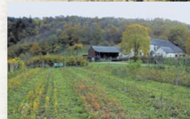
Dans la pépinière un personnel qualifié cultive de nombreuses espèces d'arbres et d'arbustes.