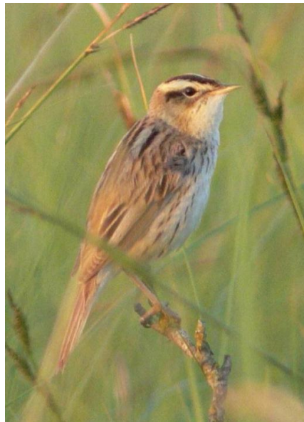
Seggenrohrsänger - Phragmite aquatique Acrocephalus paludicola