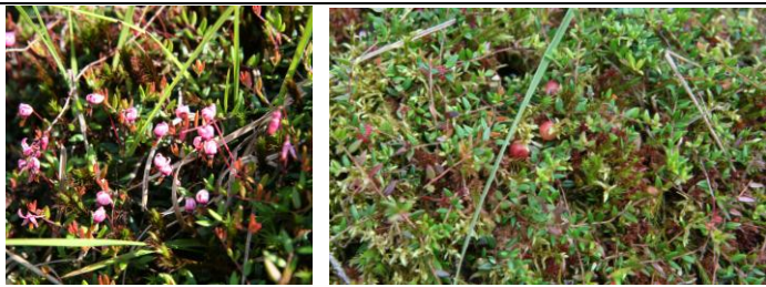
Vaccinium oxycoccus (Moosbeere) auf Torfmoos-Polster.