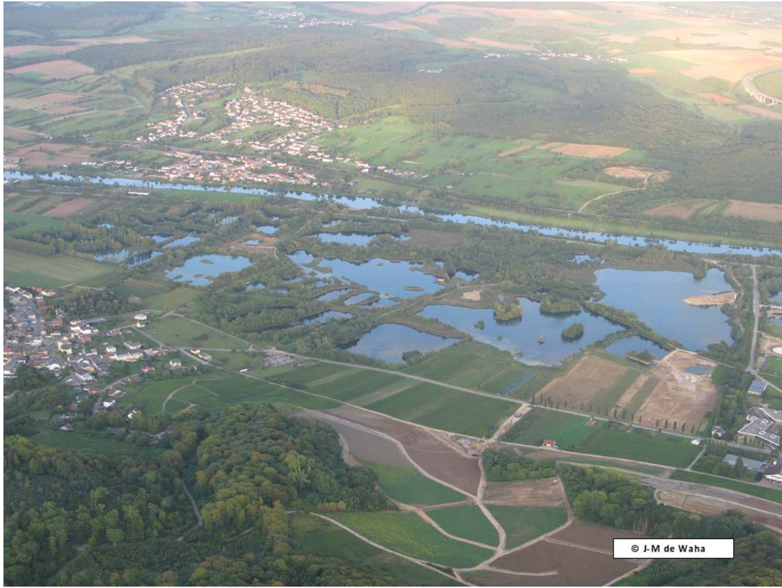
Haff Réimech – 22 septembre 2011