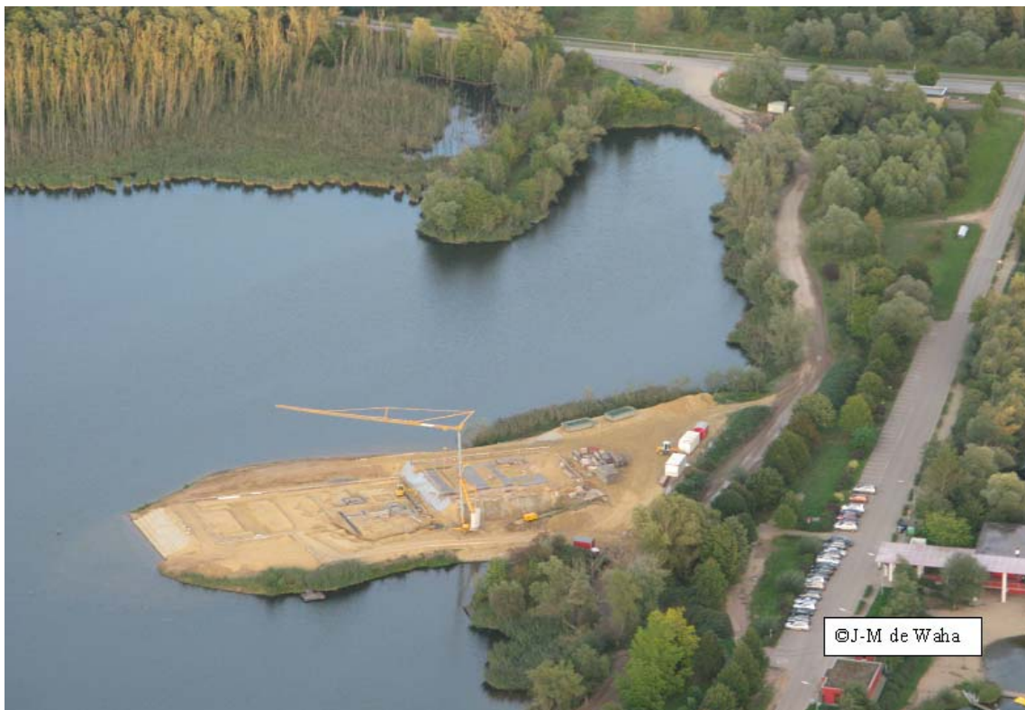
Vue du chantier « Centre d'accueil Biodiversum » - 22 septembre 2011